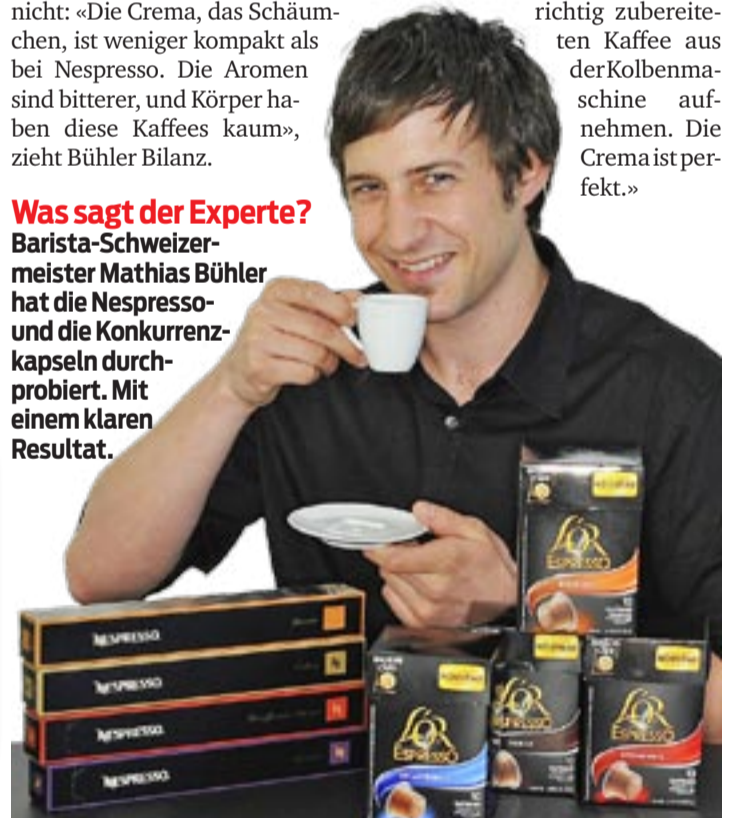
So sehen die Nespresso-Klone aus: Kapsel aus Plastik statt Aluminium.

Nur die zweitstärksten Kapseln von «L'Or» mit Namen «Splendente» schneiden besser ab als das Konkurrenzprodukt «Livanto» von Nespresso. Höchstnoten gibt Bühler der Sorte «Arpeggio» von Nespresso: «Der kann es fast mit einem richtig zubereiteten Kaffee aus der Kolbenmaschine aufnehmen. Die Crema ist perfekt.»